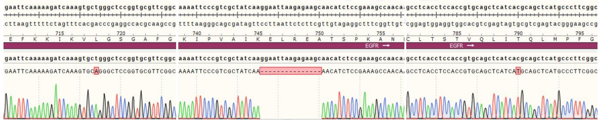
Fig 3. H_EGFR(Del19-T790M-L718Q) BAF3 Cell Line 测序结果